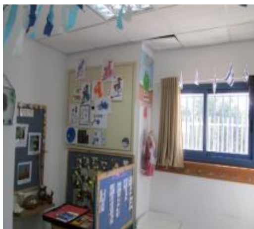
תמונה 2 : אולם הגן